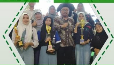
Juara 1 Desain Busana, Juara 1 Fashion Draping, dan Juara 3 Expo pada Expo Madrasah plus keterampilan se Indonesia di Palembang Tahun 2023