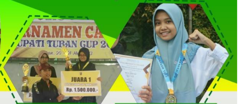
Juara 1 Turnamen Catur Bupati Tuban Cup 2023